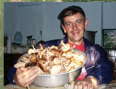
Удачная грибная охота