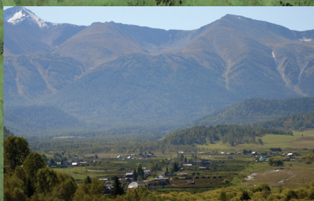
Вид с Заубы на село