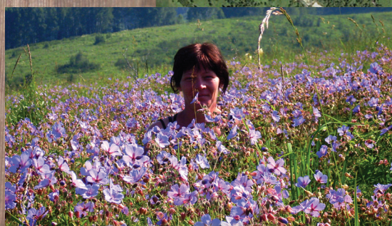
Цветет герань луговая